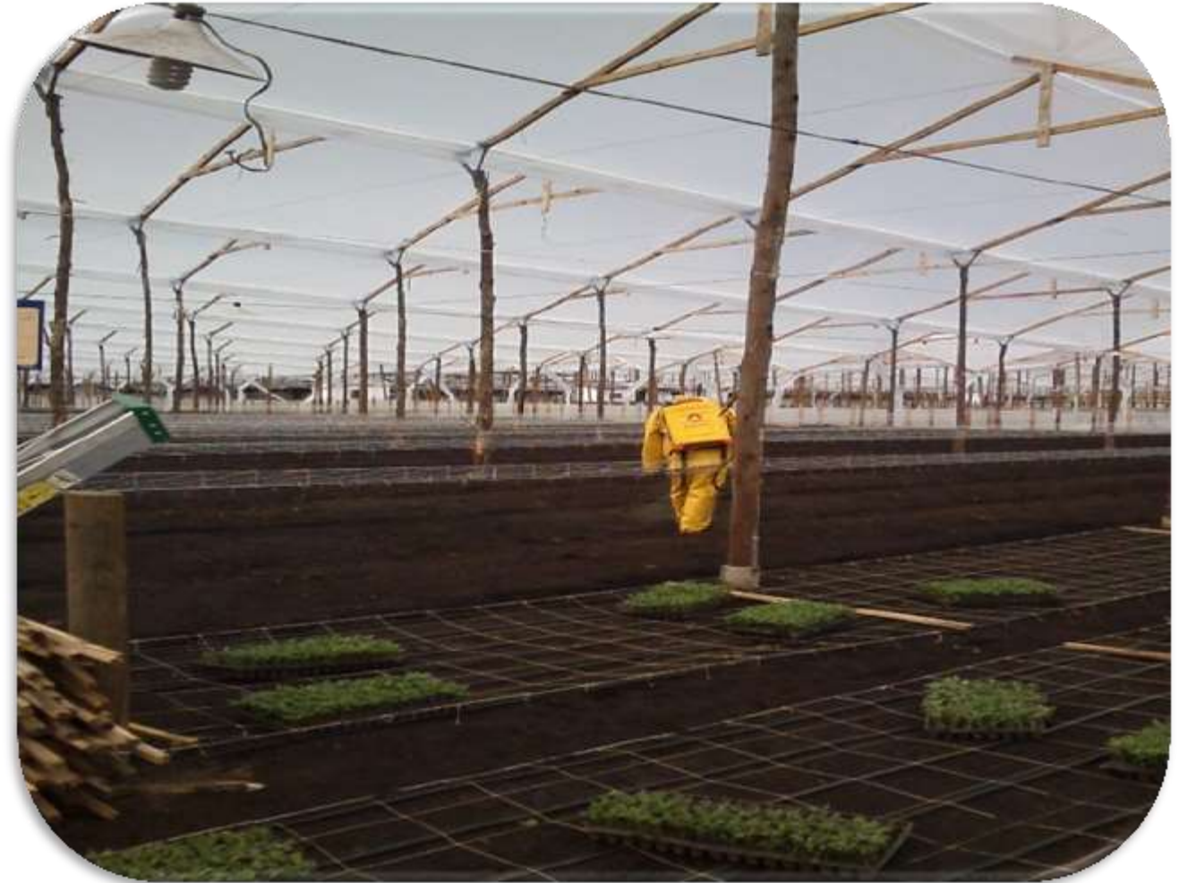
Primera aplicación (PROWL + ACTIBAS)

Siguiendo el protocolo de los tratamientos, se realizó la primera aplicación la cual se hizo para ambos tratamientos o sea en las dos naves, para un total de 16 camas. Esta aplicación se realizó un día antes a la siembra (semana 47) con bomba de espalda de 20 L y los productos que se utilizaron fueron el biológico ACTIBAS en mezcla con el herbicida PROWL, esta aplicación se hizo dirigida tanto a las camas como a los caminos.