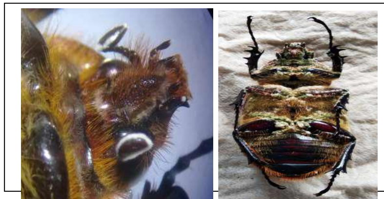
Figura 1. Formación de micelio blanco en la cavidad ocular y posterior esporulación de color verde oscuro en todo el insecto

Los insectos se colocaron en condiciones de cámara húmeda y ocho días después se evidenció, en uno de los coleópteros la presencia de micelio de un hongo en las cavidades de los ojos, luego de algunos días el micelio comenzó a aparecer en las articulaciones, inicialmente de color blanco y luego cuando se inició la esporulación tomó un color verde oscuro, con características similares a Metarhizium spp (figura 1).