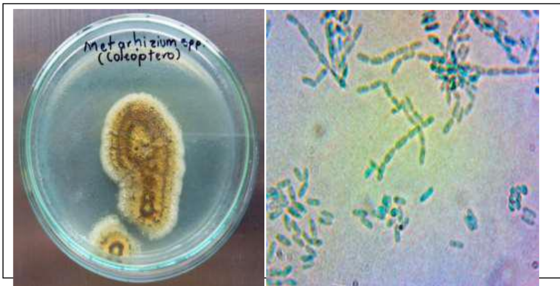
Figura 2. Observaciones macroscópicas del hongo aislado del insecto con apariencia del género Metarhizium spp.

Se tomo una muestra del microorganismo y se inoculó en medio de cultivo donde de observó macroscópicamente colonias de coloración blanca con esporulación verde oscura y textura arenosa. Al realizar la verificación microscópica, se evidenció la presencia de micelio hialino y septado, conidios con forma ovalada agrupados en cadena, lo cual coincide en su apariencia con el hongo Metarhizium spp.